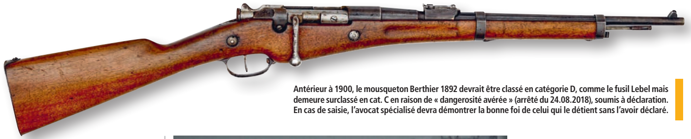
Antérieur à 1900, le mousqueton Berthier 1892 devrait être classé en catégorie D, comme le fusil Lebel mais demeure surclassé en cat. C en raison de « dangerosité avérée » (arrêté du 24.08.2018), soumis à déclaration. En cas de saisie, l'avocat spécialisé devra démontrer la bonne foi de celui qui le détient sans l'avoir déclaré.

chez les amateurs d'armes début 2018 : un couple agressé en pleine rue se voit poursuivi comme auteur des faits de l'agression ! En état de légitime défense, la femme avait en effet utilisé un aérosol lacrymogène afin de secourir son mari à terre qui se faisait rouer de coups. Alertés, les services de la préfecture avaient alors initié à leur rencontre une procédure de dessaisissement, avec perquisition au domicile du couple et saisie de toutes leurs armes sous prétexte que leur comportement était incompatible avec la détention d'armes à feu ! Mis en cause pour violence avec arme, le couple risque non seulement une sanction pénale, mais aussi une peine complémentaire d'ordre administratif : inscription au FINIADA, avec interdiction d'acquiescer d'autres armes, et même impossibilité d'être licencié dans un club de tir... L'enquête est toujours en cours, mais ce n'est pas surprenant puisque les procédures en droit pénal sont assez longues : fréquemment plus de 2 ans ! Surtout lorsqu'elles nécessitent l'intervention d'un expert judiciaire (en armes, munitions, balistique, etc.) à la demande des parties ou du juge.