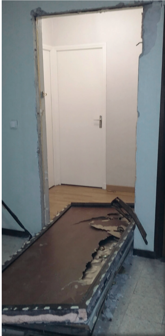
Vous n'avez pas été cambriolé : la police a perquisitionné votre domicile en votre absence, et saisi le fusil neutralisé que vous venez d'acquiescer légalement ! Mais avant de le déclarer, vous auriez dû vérifier que le TAJ ne comportait pas d'erreur à votre sujet...

Enfin, à noter que seul l'avocat est habilité à accéder aux procès-verbaux d'inventaire de saisie, les intéressés n'y ayant plus accès après les avoir signés. Or, certaines armes saisies n'y sont pas toujours répertoriées : dans le milieu des amateurs, on appelle cela "la part des anges". Ce genre de détournement est difficile à prouver, mais un collectionneur y est parvenu grâce à la photo publiée dans le journal, où apparaissait une arme non