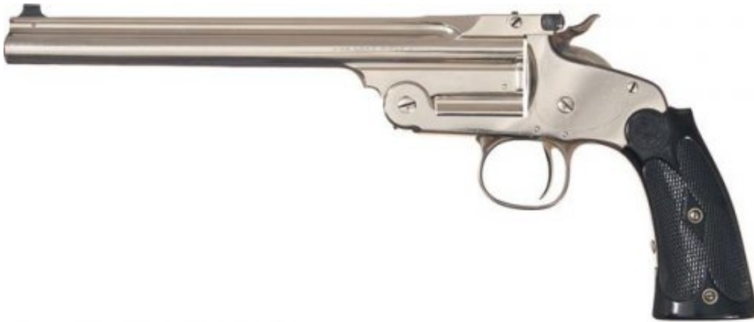
« S&W » « Single Shot » première version, encore muni du bouclier arrière de barillet hérité du revolver auquel il emprunte sa carcasse. Le marquage « Model of 91 » permet de le classer sans hésiter en catégorie D5e .

Le classement de certaines armes fabriquées à cheval sur les 19 e et 20 e siècles entraîne des débats passionnés chez les collectionneurs. Et s'il y a des armes qui suscitent bien des interrogations ce sont les pistolets Smith & Wesson à un coup aussi appelés « Single Shot pistols ». Vous verrez que nous demandons le déclassement du Smith & Wesson Single Shot fourth Model dit « Straight Line . » Il nous a paru important de revenir sur tous les modèles afin que les idées soient claires.