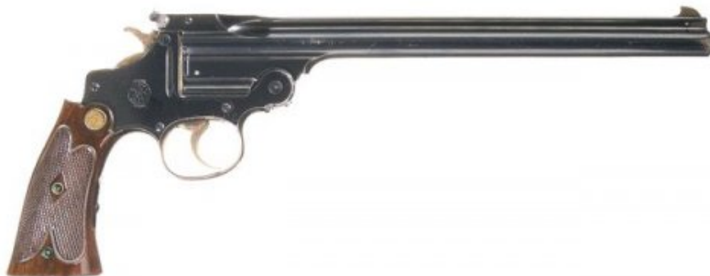
S&W « Single Shot » troisième version, monté sur une carcasse de revolver à double action « perfected model », reconnaissable à son pontet usiné dans la masse et non plus rapporté, comme sur les versions précédentes. Est classé en catégorie B .

► La troisième variante résulte de l'épuisement du stock de carcasses de revolvers à simple action calibre .38. La demande des tireurs sportifs persistant pour les « Single Shots », il est décidé de remplacer les carcasses initialement utilisées par des carcasses de Smith & Wesson double action « perfected model ». Cette troisième version est fabriquée de 1909 à 1923.