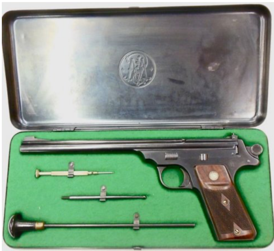
Smith S&W « Single Shot » quatrième version dit « Straight Line ». Cette arme qui a été en détention libre jusqu'en 1998, mais est classé catégorie B malgré sa rareté et sa désuétude. Cela est confirmé par la nouvelle doctrine.

Ce quatrième « Single Shot », dont la silhouette évoque celle d'un pistolet automatique, ne fait pas une grande carrière. Le dispositif de percussion en ligne se révèle d'un