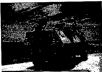
Un MILAN ER installé sur un VAB. Cette évolution laisse encore de beaux jours à l'engin. A MILAN ER installed on a VAB. That is a development that bodes well for the future of the machine.

to the French manufacturer, by the clumsiness of the DGA's intervention, which is alleged to have taken advantage of the opportunity to "pepper up" the price, and attempting to get Morocco to accept a "package" made up of warships and armored vehicles, besides the 18 Rafale fighters that had been agreed on... The "war room" is, as the Defense Minister put it: "A strategic place, where decisions can be made fast". That is an "operational" cell, gathering the President of the Republic, the General Secretary of the Elysée, the deputy General Secretary in charge of economic and industrial matters, representatives of the Prime Minister, the Defense ministry as well as the Ministry for the Economy and Finance, besides the Foreign Office. First decision of this war room, before the Head of State visit in Saudi Arabia, in the United Arab Emirates and in Qatar on the 13rd January, "SOFRESA has no more reason to be, it have vocation to disappear after the end of the current contracts" says the Elysée, "the trend is to suppress intermediates and to negotiate from State to State".